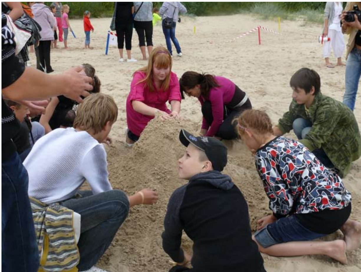
Komanda sacenšas lielākā smilšu kalna izveidē! Команда соревнуется в возведении самой большой песочной горы!