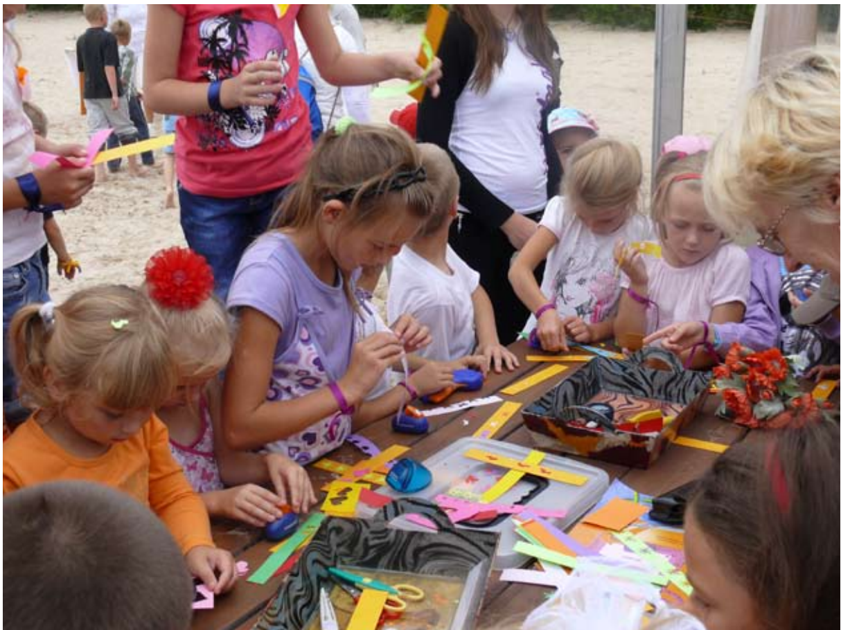
Творческая мастерская - одна из станций. Radošā darbnīca - viena no "bāzēm".