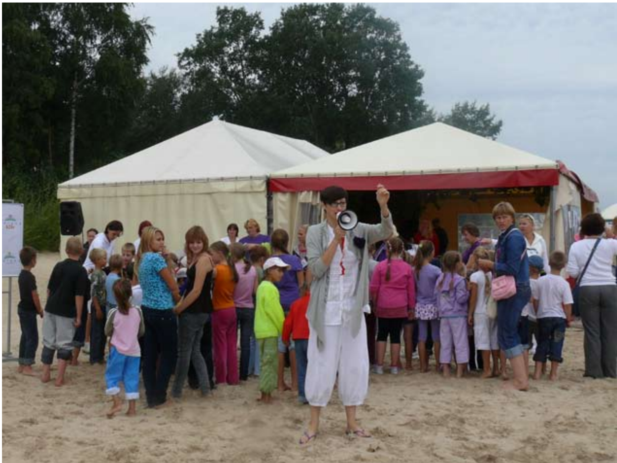
“Всем стройся!” готовимся к открытию мероприятия. “Visiem stāties rindā!” gatavojamies pasākuma atklāšanas ceremonijai.