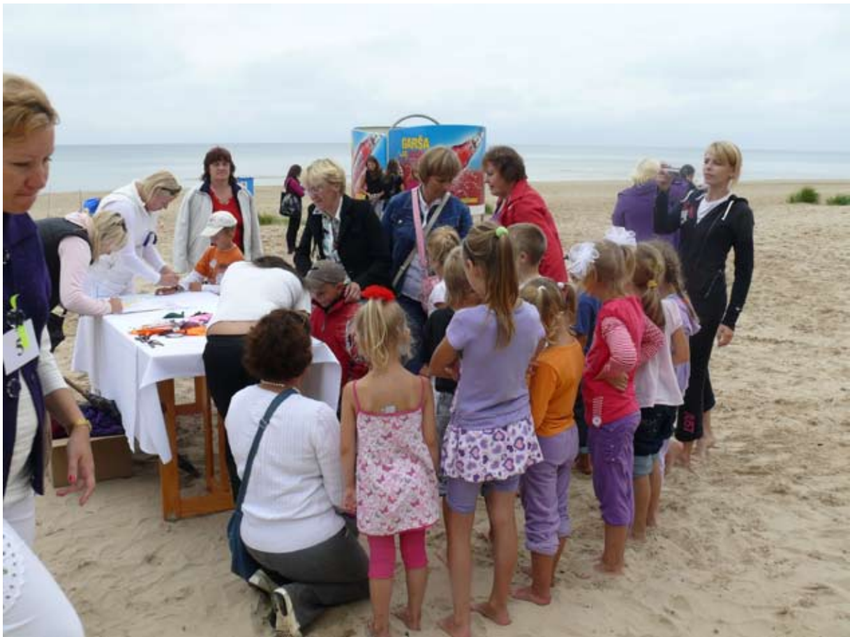
Dalībnieku reģistrācija. Регистрация участников.