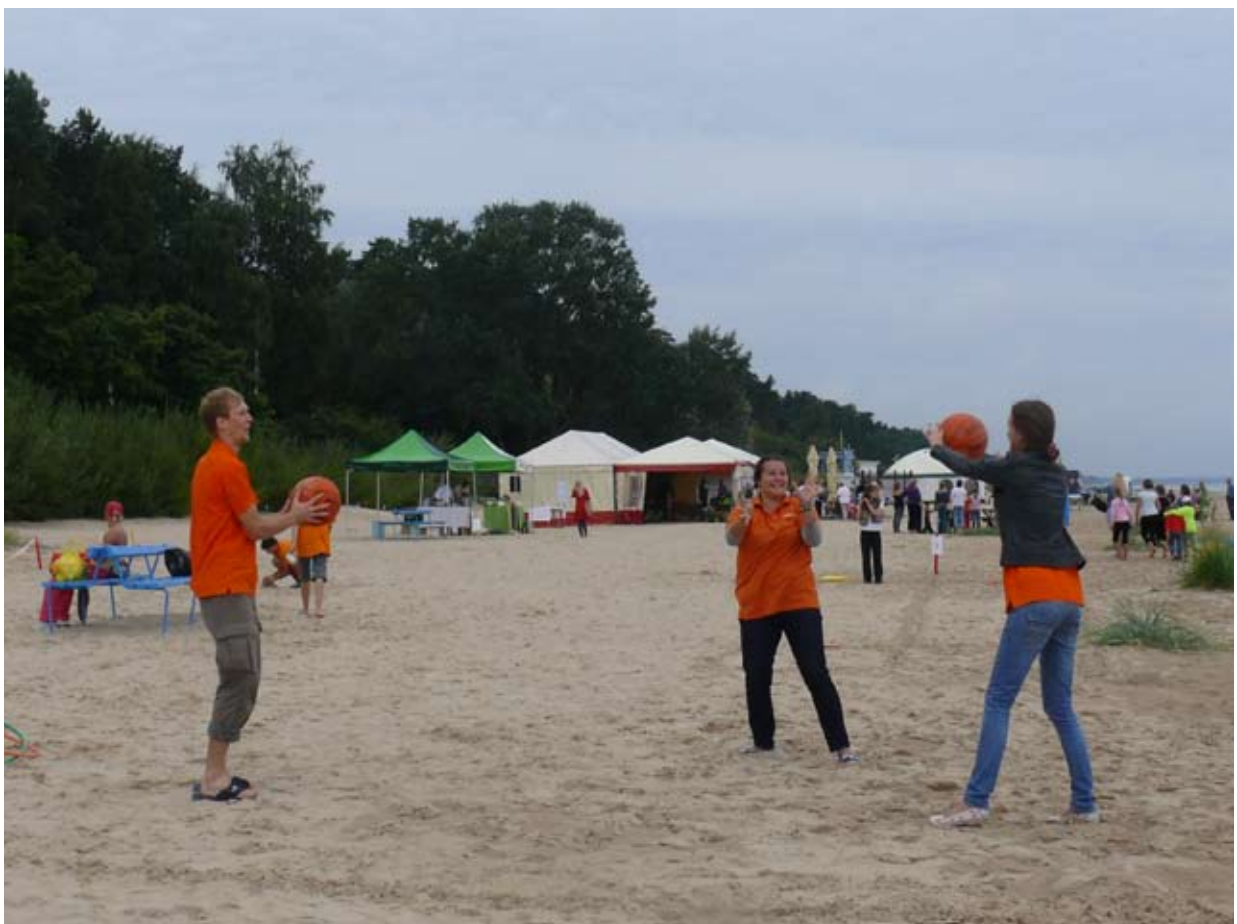
Тренера разогреваются перед стартом. Treneri iesildās pirms starta.