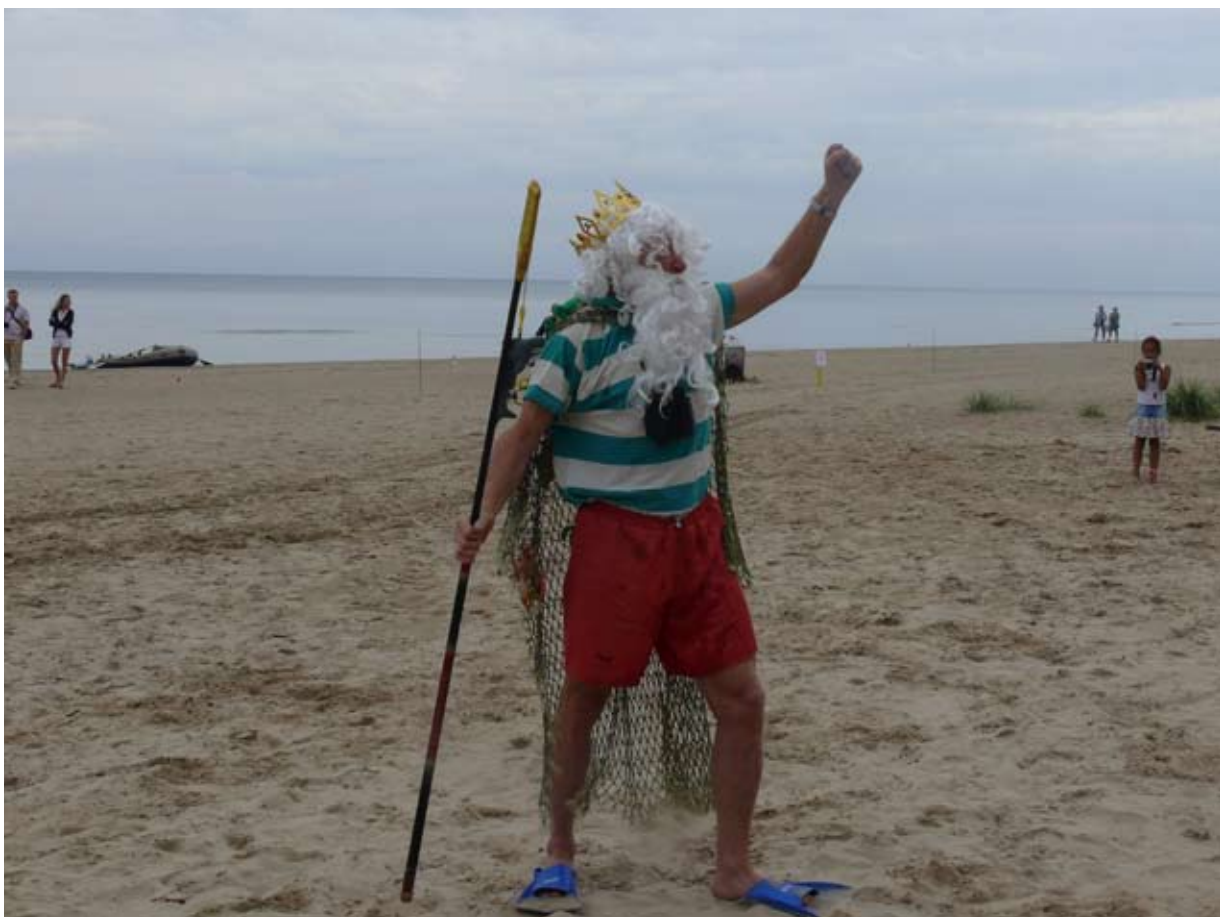
Urā!!! Neptūns ir izpeldējies krastā, lai sveiktu atbraukušos viesus! Ура!!! Нептун выплыл из моря чтобы приветствовать приезжих гостей!