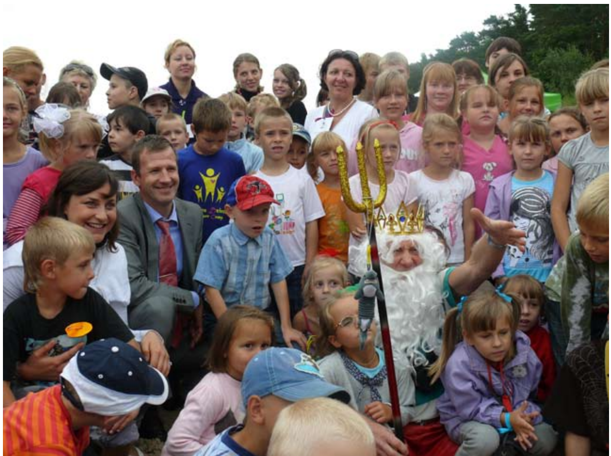
Общее фото с Нептуном! Корбilde ar Нептūnu!